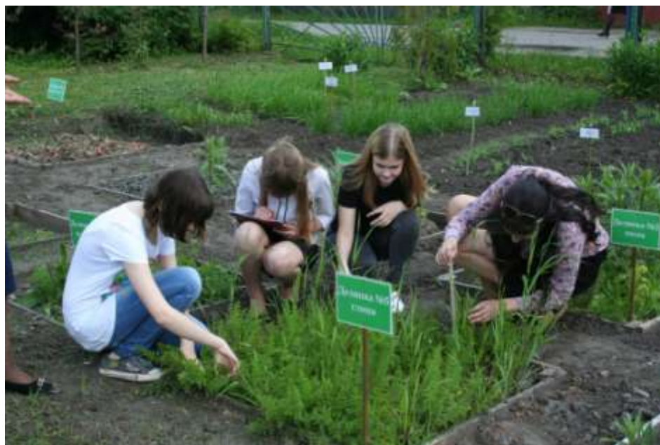
Наблюдения на Дарвинской площадке