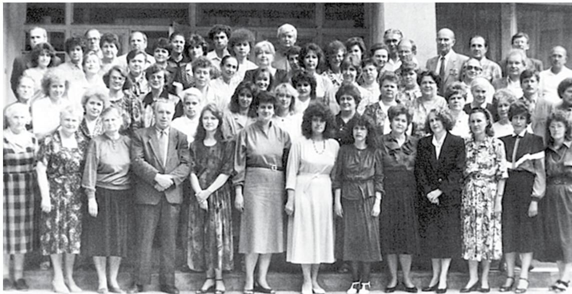
Коллектив Белгородского областного института усовершенствования учителей, 1994 год

Благодаря профессионализму, преданности своему делу, большому трудолюбию, таланту преподавателей, педагогов институт развивался, успешно выполняя свою главную миссию — повышать качество образования Белгородской области. Сегодня наш институт обладает высоким потенциалом, компетентным и работоспособным профессорско-преподавательским составом, который полон творческих планов и замыслов. Надеюсь, что всё это позволит нам эффективно реализовывать как региональные, так и федеральные инициативы. Желаю всем преподавателям и сотрудникам Белгородского института развития образования радости, профессиональных побед, счастья и любви близких, душевного равновесия, интересного и плодотворного учебного года!