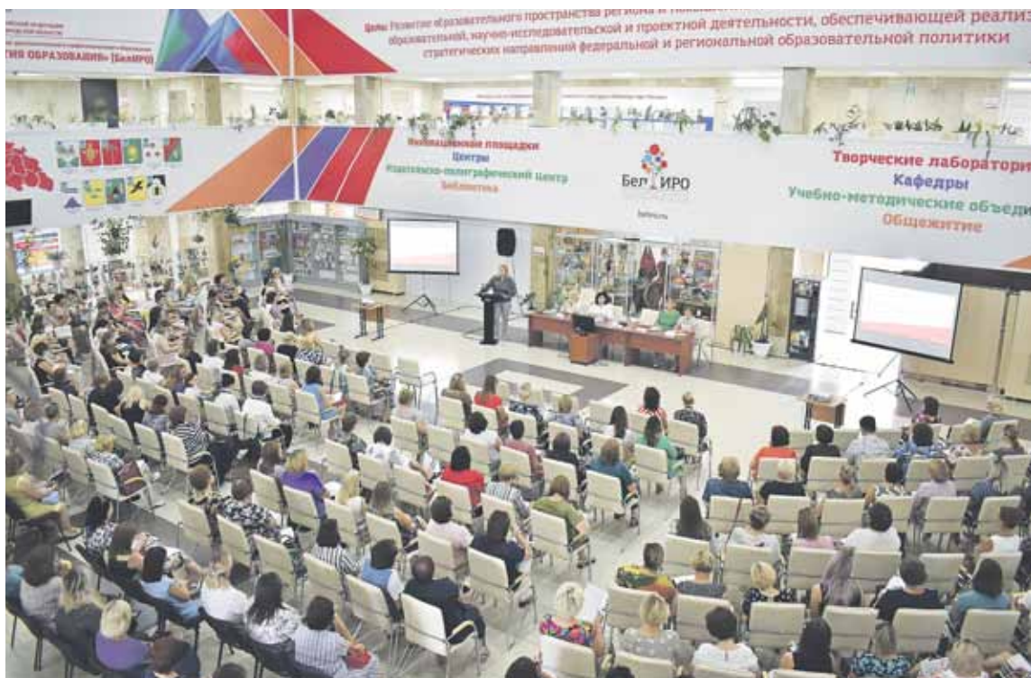
Современный, методически и технологически оснащённый центр непрерывного образования