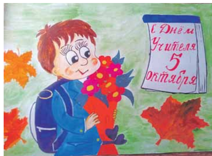
С ДНЁМ УЧИТЕЛЯ! Рисунок Валерии Шиловой (Пятницкая школа Волоконовского района)