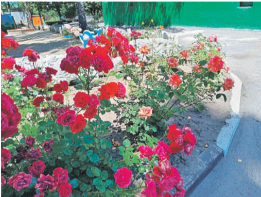
Детсад № 48 «Вишенка» г. Белгорода