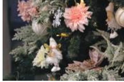
Ёлочки здесь украшают с любовью и фантазией