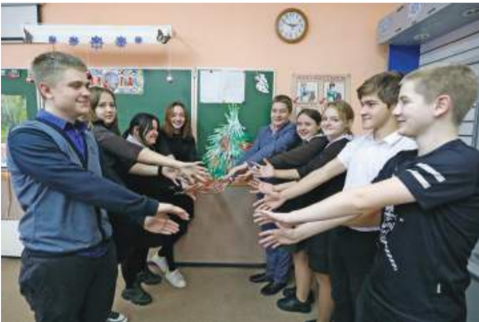
А ученики 8 «Г» класса создали свою уникальную ёлочку — вырезали её «лапки» из бумаги и украсили их своими фотографиями, которые поместили в «новогодние шарiki»