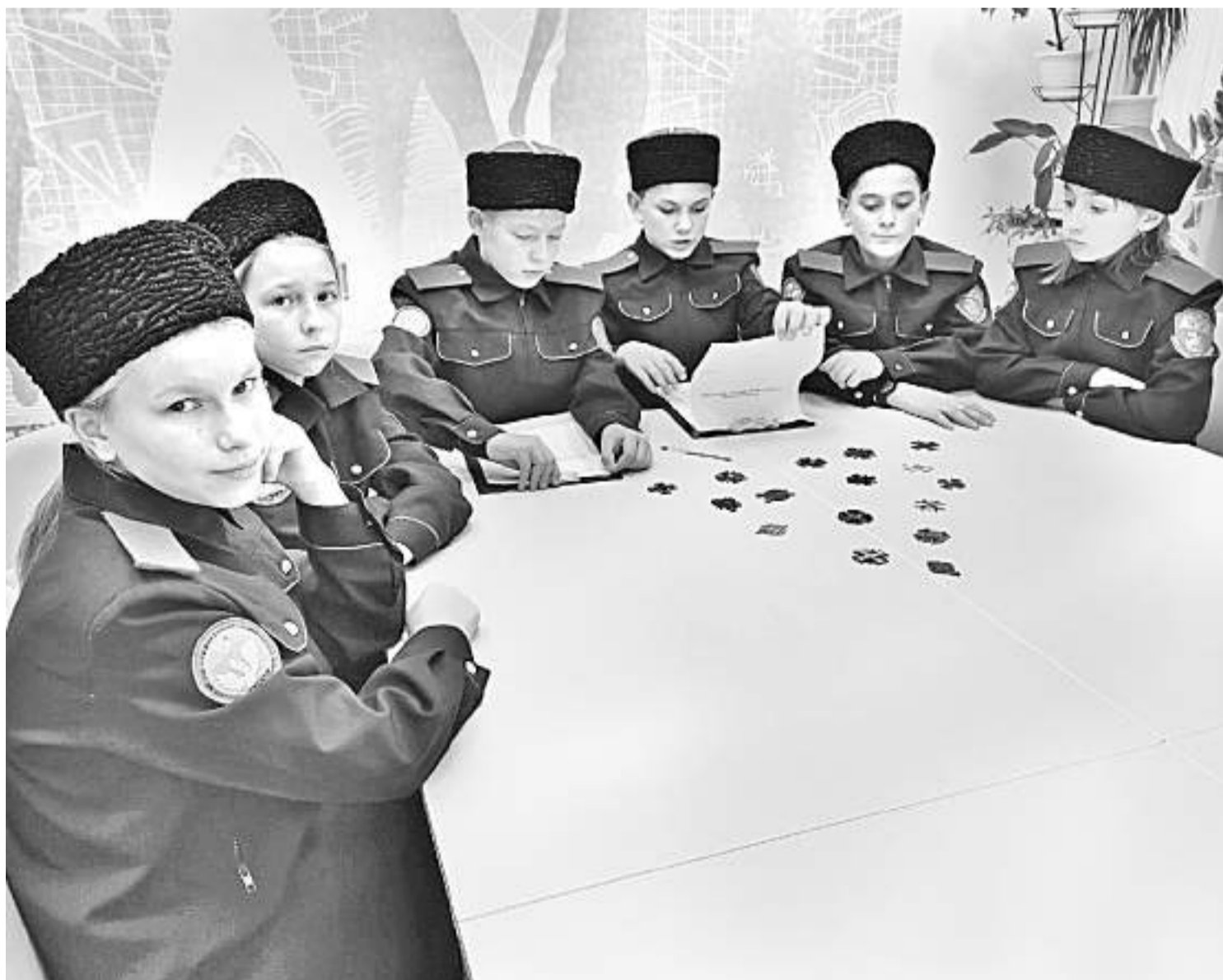
Во время смотра-конкурса на лучший кадетский класс казачьей направленности в гимназии № 6 г. Губкина