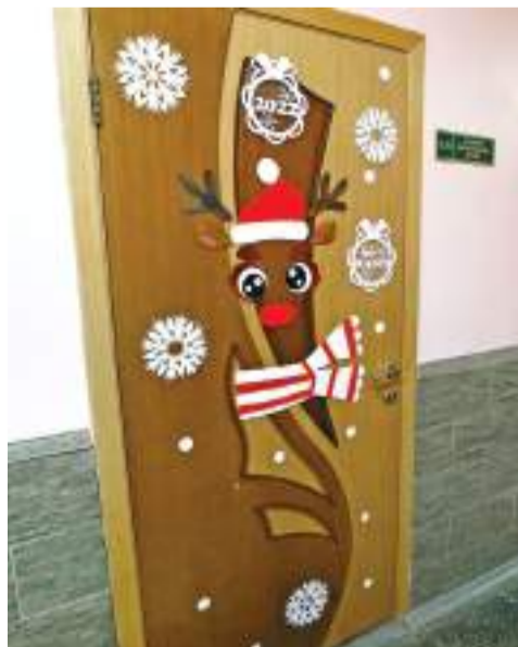
Ребята и учителя украсили двери каждого класса