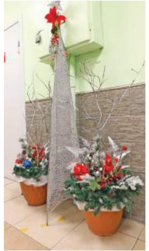
Ни одно украшение в школе не повторяется!