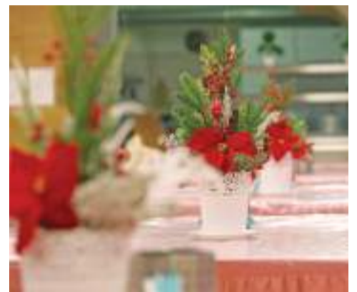
Столы в столовой тоже украшены новогодними символами