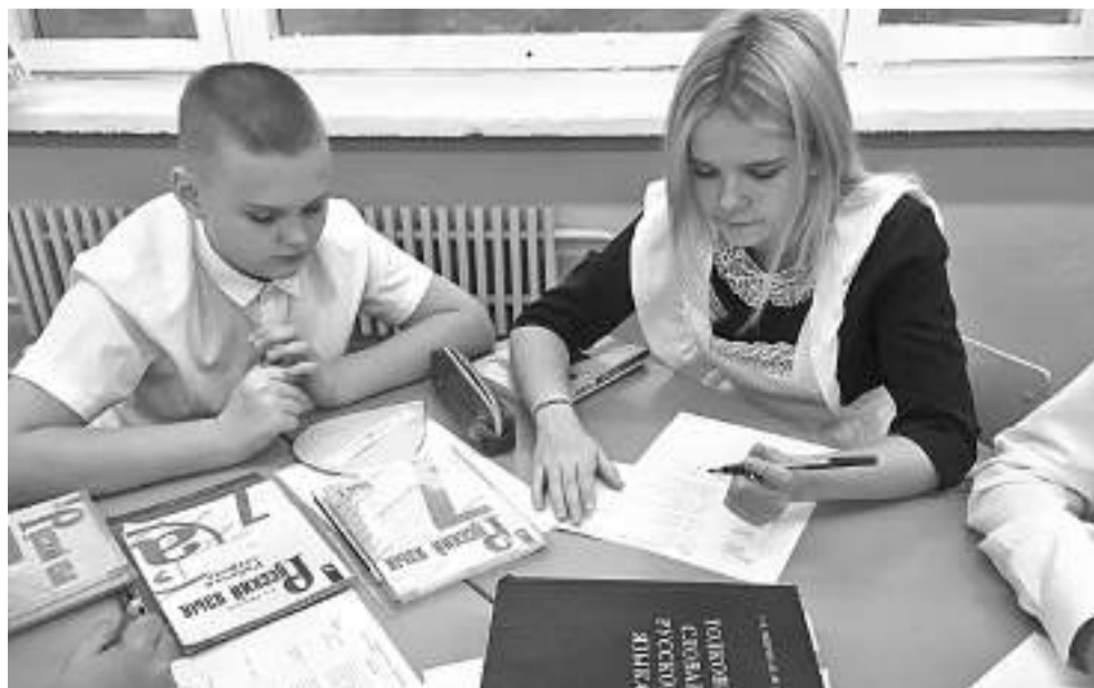
Единый методический день в школе № 17 г. Губкина