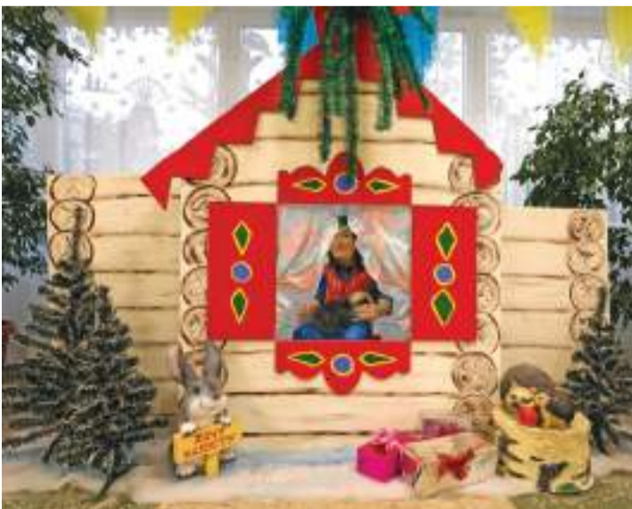
В одной из рекреаций «прописался» домик Бабы-яги. Ну а почему бы и нет?