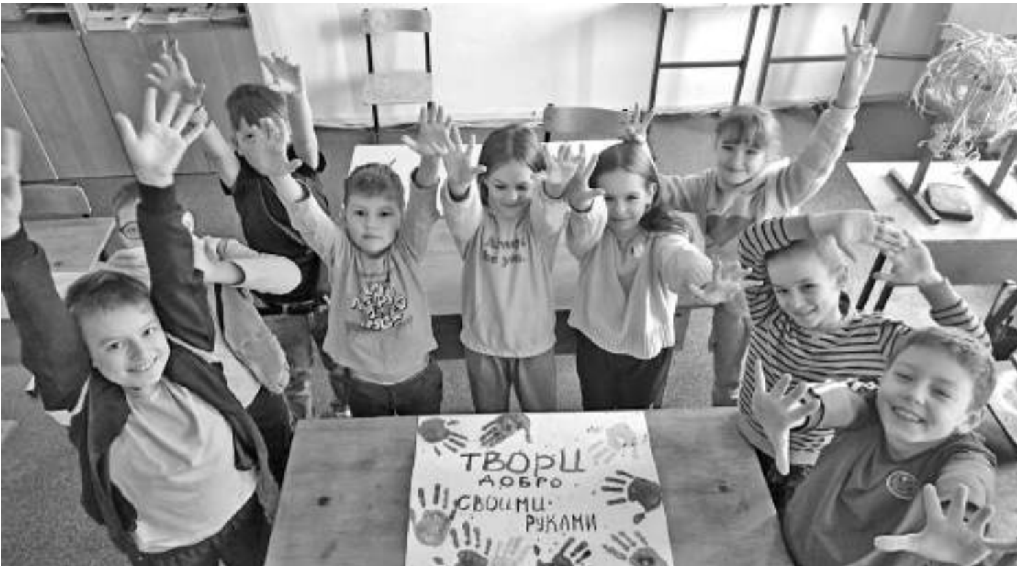
Весёлые младшеклассники школы № 13 г. Губкина

Сейчас часто можно встретить термин — «массовая школа». И педагоги, и родители понимают его по-разному. Одни считают, это самая обыкновенная школа для обычных, неодарённых детей. Другие — это школа, в которой учат по принципу «лишь бы получить аттестат». Третьи... Впрочем, что гадать? Давайте узнаем у учителей и директоров белгородских школ, что для них означает понятие «массовая школа» и как к нему относиться.