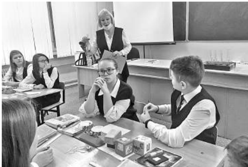
Открытый урок в школе № 17 г. Губкина

— Я посмотрел фильм «Чернобыль» и захотел выяснить, почему произошла такая авария, кто виноват, можно ли было избежать трагедии. Когда работал над темой, столкнулся с тем, что нужно очень много знать, чтобы понять даже самые простые ве-