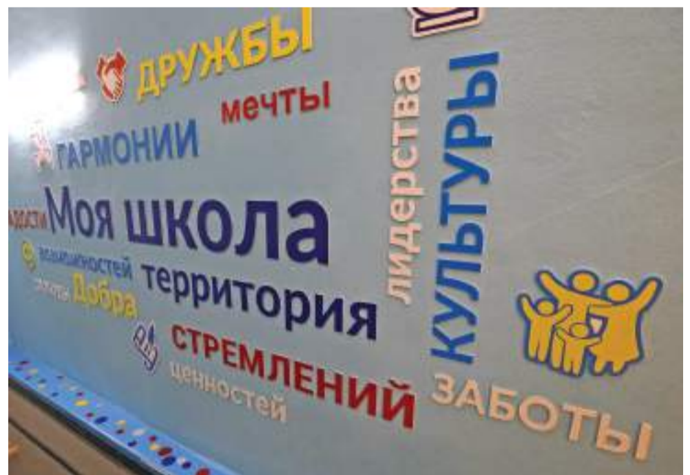
Здесь делают всё, чтобы школа стала для ребят вторым домом