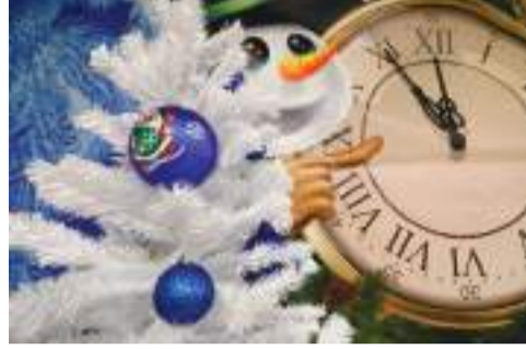
Одна из новогодних фотозон