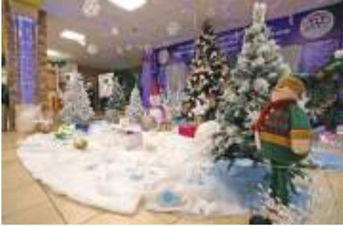
Такую новогоднюю зону в фойе сделали впервые. Так что новогоднее настроение ребят ждёт, едва они войдут в школу