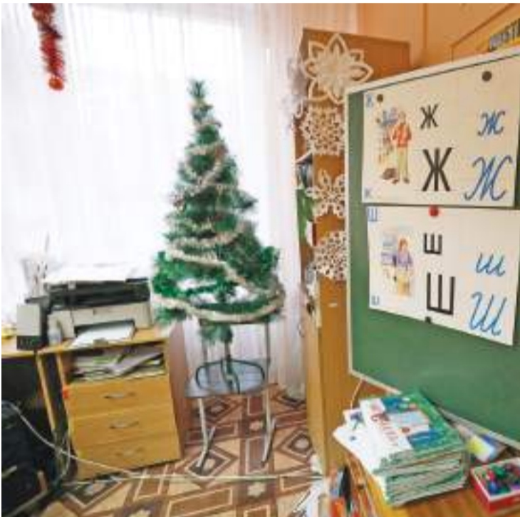
Новогодние ёлочки наряжены в каждом классе