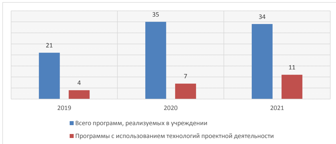
Диаграмма № 3. Количество авторских дополнительных общеобразовательных программ, с использованием технологий проектной деятельности, реализуемых в Центре

В целях профилактики распространения новой коронавирусной инфекции (COVID-19) по письменному согласию родителей (законных представителей) в весенний период 2020 года обучение по дополнительным общеобразовательным программам проводилось с использованием дистанционных образовательных технологий. Реализация программного материала осуществлялась посредством платформ Skype, ZOOM, с использованием чат-технологий в социальной сети «ВКонтакте», мессенжеров Viber, WhatsApp.