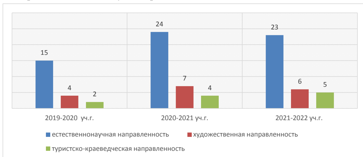
Диаграмма № 2. Количество авторских дополнительных общеобразовательных программ, реализуемых в Центре

Сравнительный анализ дополнительных общеобразовательных (общеразвивающих) программ по видам (авторские, модифицированные) свидетельствует о стабильности авторских программ. 100% программ, реализуемых в Центре в течение трёх лет имеют статус авторских.